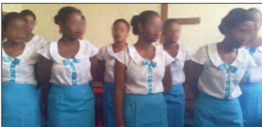
Vonona tamin'ny lafiny rehetra ireo mpandray anjara.