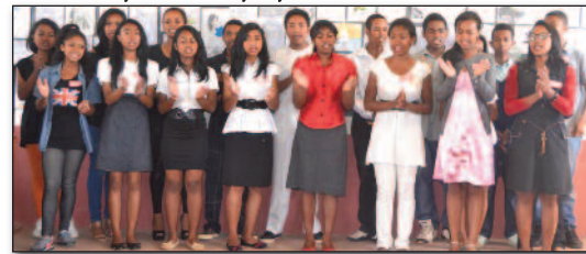
Ireo Club FF Nanisana nidera an'Ilay Mpanjaka'ny Mpanjaka

ny dia handresy lalandava. Marihina fa dia mitohy hatrany ny fianaran'ny mpianatra ny FSMI sy ny fivorian'izy ireo isaky ny Talata.■