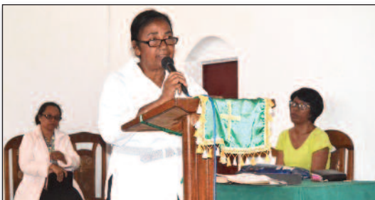
Rtoa Tale, mila fiaraha-mientana ny fitaizana ireo mpianatra

Zava-dehibe ho an'ny Fikambanan'ny mpianatra ao amin'ny Departemanta ny "Médecine Vétérinaire" eny Ambatobe ny fametrahana ny taom-pianarana eo am-pelantanan'Andriamanitra. Koa ny Alakamisy 15 Janoary 2015, ho fanokafana ny taom-pianarana 2014/2015 dia nisy fiaraha-mivavaka nokarakarin'izy ireo. Ny lohahevitra nofidian'izy ireo tamin'izany moa dia: "Fiaraha-monina amin'Andriamanitra"; Andriamanitra ilay Teny tonga nofo ka nonina tamin-tsika. Amin'ny maha mpiara-miasa ny Feon'ny Filazantsara (FF) amin'izy ireo eo amin'ny fampandrosoana ny asa fitoriana eny an-toerana dia nandray anjara tamin'ny fiaraha-mivavaka ny solon-tenan'ny FF: fitarihana ny fotoana sy fanentanana sy famporisihana ireo mpianatra handalina ny Tenin'Andriamanitra. Satria tokoa ny fianarana sy ny fiainana ny Tenin'Andriamanitra no hahafahan'Andriamanitra miara-monina amintsika.■