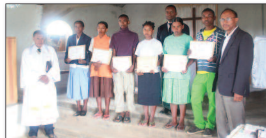
Notronin'Atoa Talen'ny FF ny fanolorana diplaoma