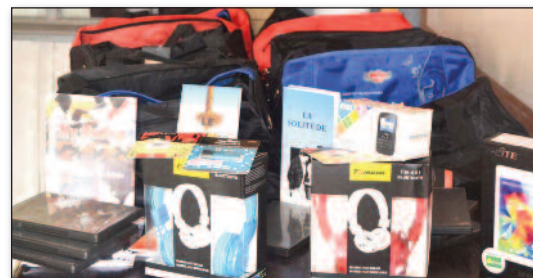
Ireo lokan'ireo folo voalohany