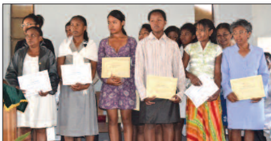
Ireo mpianatra notolorana Sertifika