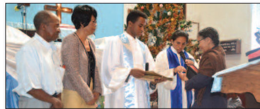
Tsy mifidy taona ny fandalinana ny Tenin'Andriamanitra