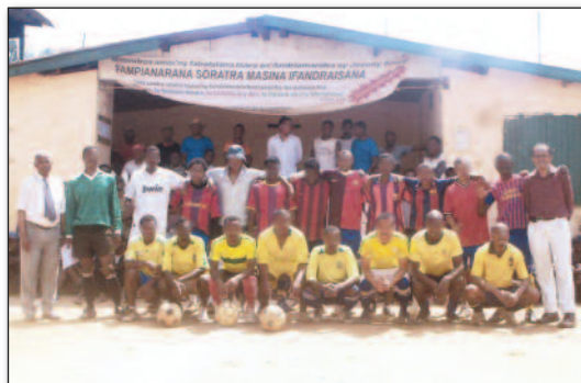
Anisan'ireo ekipa nandray anjara

Izany dia nalaina tao amin'ny Marka 12:28-34. Ny hafatra nampitaina moa dia ny hoe: tsy misy didy hafa lehibe noho ny fitiavana an'Andriamanitra sy ny fitiavana ny namana. Nomena "Fanion" misy ny sary famantarana ny FF ny Ekipa nandresy tamin'ny lalao famaranana ary nozaraina vary iray kilao avy isan'olona ny voafonja rehetra zay nandray anjara tamin'izao fifaninanana lalao baolina kitra izao. Nahatratra valopolo mahery (mpilalao sy mpitsara ary mpitantara) ny isan'izy ireo. Testamenta vaovao miisa 20 koa no natolotra mba hovakian'ireo mpianatra manaraka ny FSMI. Marihana fa nandritra ireo lalao fifanitsanana rehetra dia naranty tsy tapaka ny "banderole" mampahafantatra ny FSMI ary nisy hatrany koa ny fanentanana ireo voafonja marobe mpijery lalao mba hirosoan'izy ireo handalina ny Tenin'Andriamanitra, ilay Teny mamelona sy manafaka. Antenaina fa hitombo betsaka hatrany ny isan'ireo mpianatra vokatr'izao hetsika sy fanentanana izao. "...tao an-tranomaizina Aho, dia novangianareo" Matio 25:36b.■