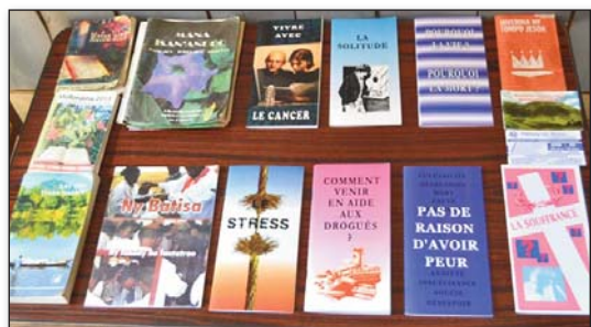
Ireo bokikely kristiana

Tamin'ny alalan'ny fihaonana isan-toerana tamin'ireo raïamandreny Pastora sy Mpitandrina amin'ny Fianganana dia tsapa tokoa fa dia samy resy lahatra ny rehetra, ka tokony hifanomezantana ny fampandrosoana ny Asa Fitoriana ny Filazantsara. Iray ihany mantsy ny fikendrena dia ny hitarihana olona maro ho ao amin'ny Fianganana, ny hitombohan'izy ireo amin'ny Finoana ka ho tafatoetra amin'izany finoany izany. Ary tsy hijanona hatreo fa hazoto hizara koa ny Tenin'Andriamanitra amin'ny hafa. Andriamanitra irery ihany no omem-boninahitra amin'ny fivelaran'ny asa. ■