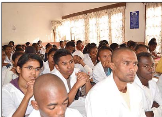
Ireo mpianatra teny amin'ny Sekoly ambony ISPPS