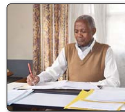
4- Fitsarana ny adina