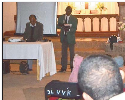
Natomboka tamin'ny fiaraha-mivavaka ny fijerena ny horonan-tsarimihetsika (FLM Toby Fiaferana)

Manana anjara toerana lehibe eo amin'ny programan'ny Feon'ny Filazantsara (FF) ny fiarahamiasa amin'ny Fiangonana, anisan'izany ny fandraisan'anjara amin'ireny fotoan-dehibe karakarin'ny Fiangonana ireny. Teo ohatra ny 06-07-08 Jona 2014 izay nankalazana ny Isantaona faha 21 n'ny Tobimpifohazana Fiadanana Ambohijanaka Fiaferana, miray amin'ny Tobilehibe Ankaramalaza, ao amin'ny Fileovana Tsarahonenana (FLM), SPAnta. Ny Alahady 03 Aogositra 2014 kosa dia nanamarika ny iray volan'ny Vondrona Fototra Laika (VFL) ny FJKM Ambohimadana Fanilo SPAA 11. Ho valin'ny fanasan'izy ireo àry dia nanana anjara tamin'ny fandaharam-potoana ny Feon'ny Filazantsara. Ny Zoma 06 Jona 2014 no nanatanteraka ny Fandefasana horonan-tsarimihetsika teny amin'ny Tobimpifohazana Fiadanana Fiaferana ary ny Alahady tolak'andro ny teny amin'ny FJKM Ambohimadana Fanilo. Ny horonan-tsarimihetsika mitondra ny lohate-ny "Dian'ny mpivahiny" no nentin'ireo solon-tenan'ny FF nampitana ny hafatry ny Soratra Masina. Hafatra izay naneho indrindra ny fizotry ny fiainana kristiana izay feno ady, nefa rehefa nanaiky sy niaina ny Tenin'Andriamanitra izy, dia nahatratra ny tanjona nokendreny, dia ilay fiainana mandrakizay izany. Isaorana Andriamanitra, fa maro ireo olona tonga namaly ny antso nandritry ireo fotoana roa ireo. Nahaliana sy nahafinaritra ireo mpivory ihany koa moa ny fandaharana ary dia naneho ny faniriany izy ireo ny hitohizan'ny fiaraha-miasa hatrany. ■