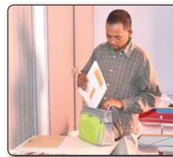
7- Averina any amin'ny mpianatra ny adina vita fitsarana