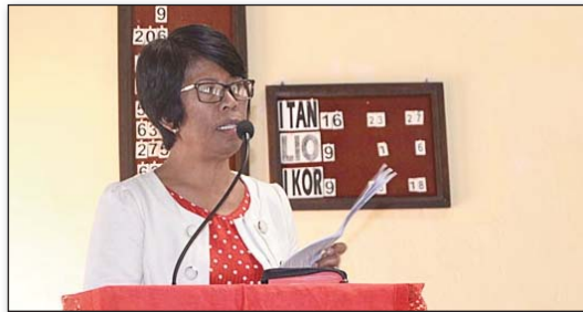
Tsy mitsahatra ny mamporisika ireo kristiana handalina ny Tenin'Andriamanitra

nahafahana nampahery ny tsirairay amin'ny maha zava-dehibe ny fitoriana ny Filazantsara. Nisaotra noho ny amin'ny asan'ny FF Ramatoa mpitandrina ary faly ny amin'ny fitohizana ny fiaraha-miasa. ■