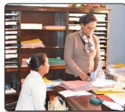
2- Fandraisana ireo adina tonga