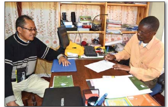
Fanaovan-tsonia FF-Radio Université Toliara sy Radio Fahazavana Mahajanga