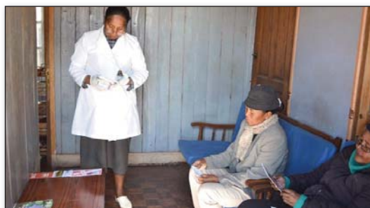
Samy liana namaky na ny Dokotera mpitsabo na ireo hitsabo nify