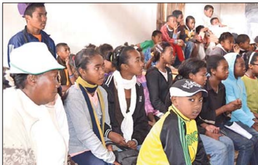
Nankafy ary dia nanaraka tsara ny horonantsary (Sekoly «Les Cinq Ruches»)