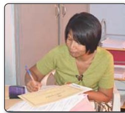
6- Manomana ny lesona alefa manaraka sy ny diplaoma