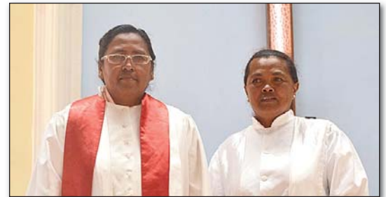
Rtoa Fanja R Mpitandrina sy Rtoa Sahondra volontaire FF