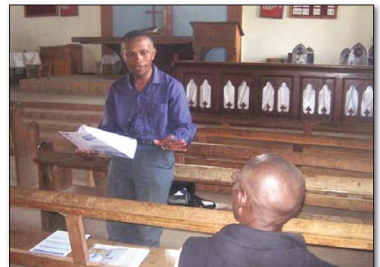
Fiaraha-miasa vaovao miaraka @ Mpitandrina FJKM Ambohimasimbola Fitiavana

Boatin-drakitra: ezaka fampitaovana hajia