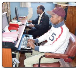
5- Atao «saisie» ny naotiny ny mpianatra