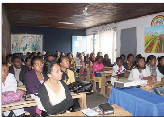
Ireo mpianatra sy mpanabe teny amin'ny Sekoly Ambony INSPNMAD

lalana sy Tenin'Andriamanitra izay manampy amin'ny fiatrehana ny olana eo amin'ny fiainana andavan'andro. Ankoatra ireo Sekoly ambony tsy miankina moa dia efa anisan'ny mpiara-miasa amin'ny FF ny Département Médecine Vétérinaire mampely ny asa Fitoriana eny anivon'ny Oniversite. ■