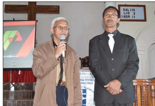
Nanatrika ny fotoana ny raiamandreny Mpitandrina sy ny Filohan'ny VFL (FJKM Ambohimadana Fanilo)