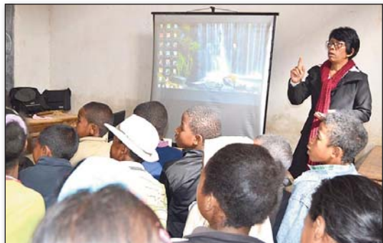
Nandray anjara mavitrika tamin'ny ffampizarana ny hafatra ireo mpianatra

Ny hafatra nentina ho an'ireo mpianatra alohan'ny hisarahana moa dia nikasika indrindra ny voka-dratsin'ny fialonana izay miteraka ny fankahalàna sy ny tsy fitiava-namana. Hitohy hatrany amin'ny taom-pianarana vaovao moa ny fiarahamiasa. ■