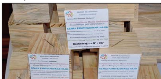
Santiona amin'ireo boatin-drakitra

"Mahasambatra kokoa ny manome noho ny mandray" Asa 20:35b. ■