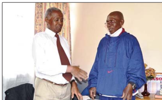
Anisan'ireo 'volontaires' misahana ny asa eny amin'ny fonja

Araka ny voalaza teo aloha (cf Gazety Akon'ny Feon'ny Filazantsara Laharana faha 12), nanomboka ny volana Jona 2013 lasa dia novaina ho tetik'asa "Prison Ministry" ny fiaraha-miasa atolotra ireo voafonja sy mpandraharaha eny Antanimora.