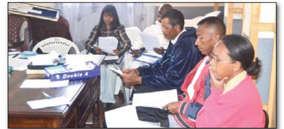
Fanomanana ireo 'volontaires' hanatanteraka fanadihadiana

Isaorana an'Andriamanitra fa tanteraka soamantsara ny fanitarana ny fandaharana any amin'ny faritra Antsirabe. Tontosa tamin'ny 12 jolay mantsy ny fifanaraham-piaraha-miasa amin'ny Radio iray ao antoerana "Radio Feon'ny Mpitily" RFM FM 92, isaky ny Asabotsy 9.30mn maraina, famerenana Alatsinainy 5 ora 30mn maraina. Ny 27 Jolay 2013 no nanomboka nalefa ny fandaharana voalohany izay niompana tamin'ny fampahafantarana ny LHM sy ny fandaharana "Henoy ny feony".■