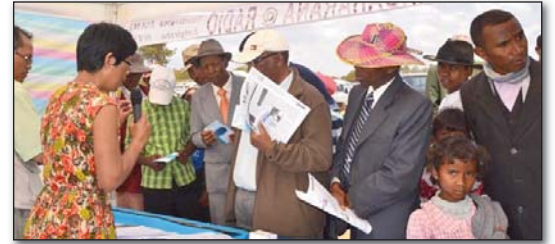
Maro sady liana ireo mpitsidika ny 'stand'-n'ny Feon'ny Filazantsara

Synodam-paritany maromaro manerana ny nosy: SPAnta, SPFT, SPAF, SPATs, SPTm, SPA, SPAl, SPAFi ary indrindra ny SPAM. Fotoana natao indrindra koa nihaonana tamin'ireo Pastora mpiara-miasa ao amin'ny SPAM (hanaovana jery todika ny fiaraha-miasa), ireo "Volontaires" ary ireo mpianatra manaraka ny "Fampianarana Soratra Masina". Misaotra an'Andriamanitra lehibe tokoa fa dia maro ireo mpianatra teo aloha no naniry ny hanohy ny fianarany indray. Tao ihany koa ireo resy lahatra hiroso amin'ny Fandalinana ny Soratra Masina, nisy ireo maniry hanao "volontaires". Nahatratra teo amin'ny 1 000 ireo olona nitsidika ny "Stand". ■