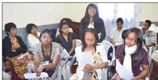
Jemima mijoro eo aorian'ireo 'volontaires' vaovao