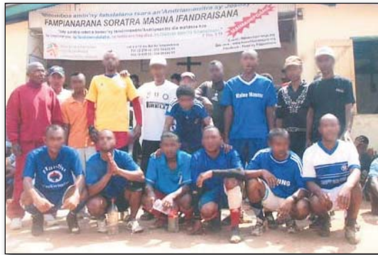
Isan'ireo ekipa nandray anjara ary fanolorana ny amboara